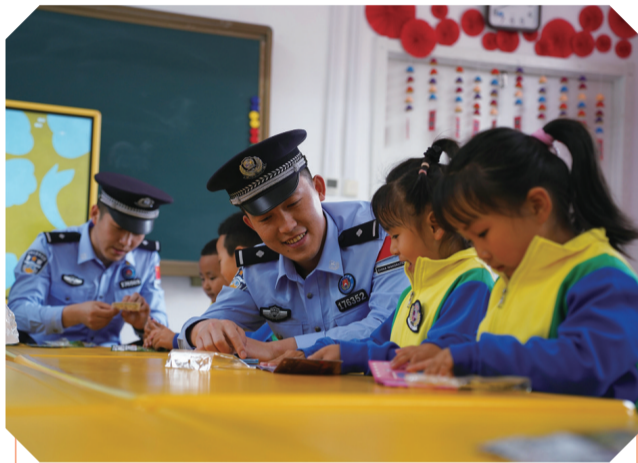
儿童节来临之际,白山边境管理支队长川边境检查站和四道沟边境派出所为学生们送上一堂生动的安全教育课。

开展点验,是强化基干民兵国防观念,筑牢政治意识、战备意识、尽责意识,确保“召之即来、来之能战、战之必胜”的重要举措。乡武装部领导表示,要建强基干民兵队伍,打造一支“建在身边、抓在手中、用在关键”的民兵队伍。要着眼时代需求,紧紧围绕支援保障作战、安保维稳、抢险救灾等使命任务,紧贴应急应战行动开展训练,全面提升基干民兵的素质技能。