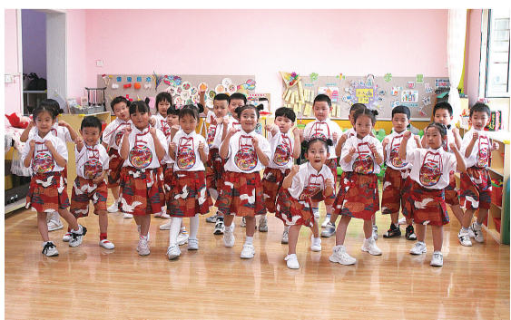
儿童节来临之际,图们市幼儿园举办“同心向阳、快乐成长”亲子运动会。图为小朋友表演舞蹈。

精彩纷呈的现场演练让孩子们流连忘返。随着相机的定格,孩子们灿烂的笑脸为此次警营开放日宣传活动画上了圆满的句号。(佟雪冬 张士鹏 佟磊)